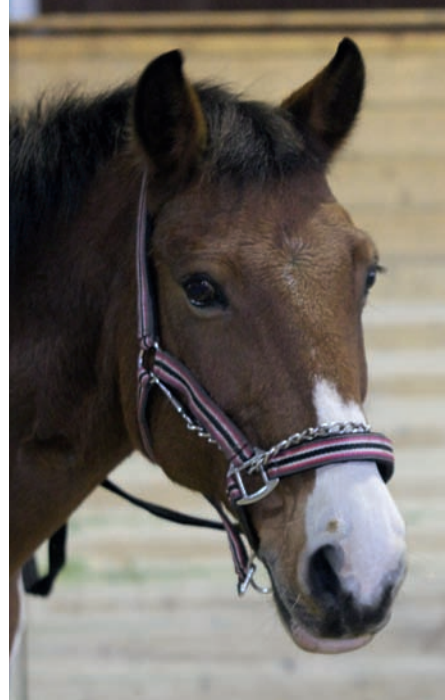
Links: Richtig angebrachte Führkette