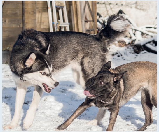
Gut zu sehen, wie der Malinois mit Beschwichtigungssignal auf das Drohen des Huskys reagiert.

Kennzeichnend für Beschwichtigungssignale ist, dass sie in konflikträchtigen Situationen vermehrt gezeigt werden und aggressionshemmend auf das Gegenüber wirken. Wissenschaftlich belegt sind Maulwinklecken, das Sich-klein-Machen, das Pfö-teln, die Blickvermeidung und einige Demutsgesten. Auch das Absetzen von Harn in Kombination mit einer unterwürfigen Körperhaltung dient der Beschwichtigung und ist nicht selten bei ängstlichen Tieren zu sehen. Beschwichtigungssignale werden »von unten nach oben« (hierarchisch gesehen, nicht körpersprachlich!), gesendet.