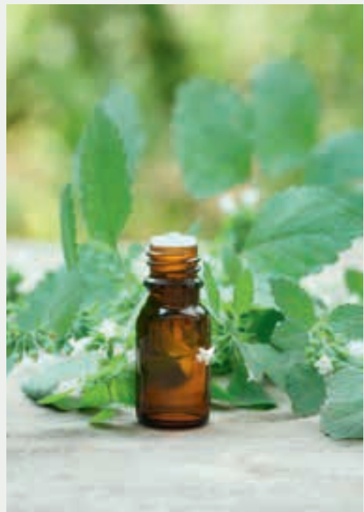
Die ätherischen Öle und Gerbstoffe der Melisse regen den Stoffwechsel an.

Welche Verarbeitungsmethode für Sie die leichteste und angenehmste ist, werden Sie im Laufe Ihrer Anwendungen schnell herausfinden. Einige Pferde mögen sehr gerne warme Mahlzeiten, anderen muss man Heilkräuter erst schmackhaft machen. Probieren Sie mit Ihrem Pferd alles aus, dann finden Sie den richtigen Weg.