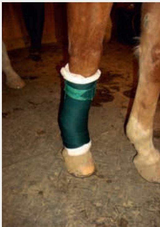
Achten Sie beim Anlegen der Bandage darauf, diese nicht zu fest anzuziehen.

weise gut zur Wundheilungsförderung eingesetzt werden.