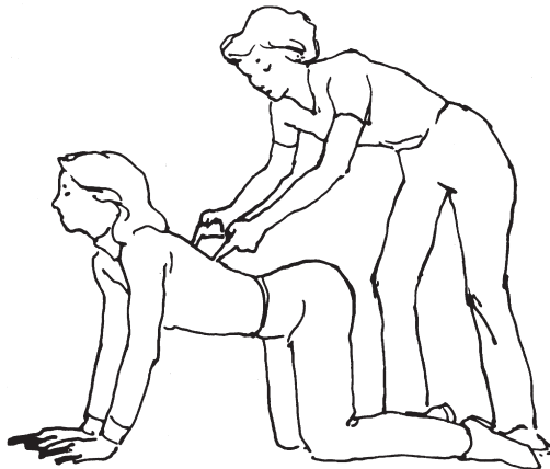
Abb. 1: »Aua!« Genau das möchte uns unser Pferd manchmal sagen.

Aber genau das tun wir unseren Pferden an, wenn wir ihnen bei jedem Trabschritt in den Rücken plumpsen, wenn wir im Galopp in den Sattel klappen, wenn wir beim Leichttraben zu schwer einsitzen oder wenn wir aufsitzen und uns – wumm – auf den Pferderücken fallen lassen. Ihre Reaktion auf diese Übung war, sich vor dem »Wumm« zurückzuziehen, Ihren Rücken durchzudrücken und den Kopf anzuheben. Wie oft haben Sie ein Pferd in dieser Weise reagieren sehen, unglücklich, verspannt, den Rücken weggedrückt? Die Nase des Pferdes geht nach oben, seine Augen haben einen nach innen gerichteten, ängstlichen Ausdruck und die Ohren sind angelegt. Es sieht verspannt und bekümmert aus; es schlägt mit dem Schweif und bewegt sich mit kurzen, steifen Tritten.