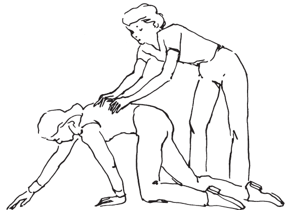
Abb. 2: »Oh – toll!« Auch dem Pferd gefällt es so besser.